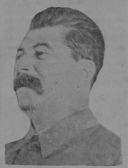
Stalin, el mejor testimonio relacionado con su trabajo proviene de un oficial blanco, el coronel Nosovitch, que había servido en el Ejército Rojo y después desertado al ejército blanco.

En este momento, los remanentes del ejército revolucionario ucraniano, dirigido por Voroshilov, llegaron a Tsaritsin, habiéndose retirado a través de las estepas del Don, bajo el ataque de los alemanes y hostigados en el camino por los cosacos y otros rebeldes. Stalin convirtió en jefe de todas las fuerzas militares de los alrededores de Tsaritsin.